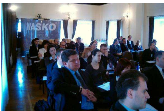
Uczestnicy Konferencji reprezentowali najważniejsze instytucje państwowe oraz firmy teleinformatyczne