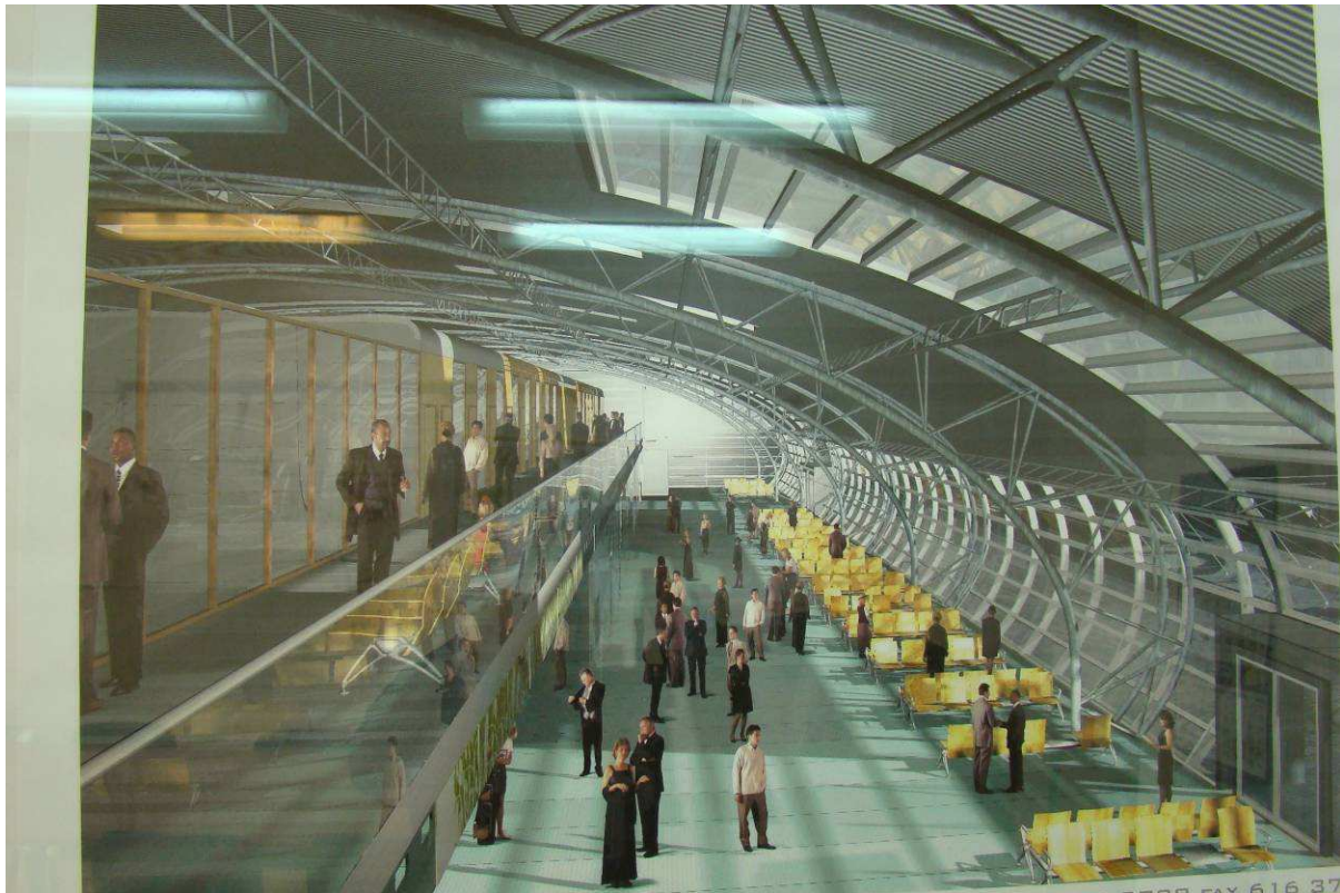
Foto.2. Koncepcja architektoniczna Terminala Pasażerskiego Portu Lotniczego „Warszawa – Modlin” . APA Kuryłowicz & Associates.