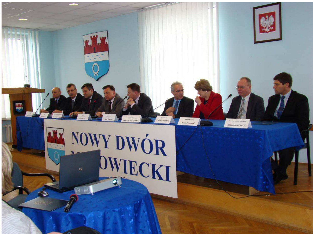
Foto.5. Uczestnicy aktu podpisania decyzji środowiskowej dla Portu Lotniczego „Warszawa – Modlin”.