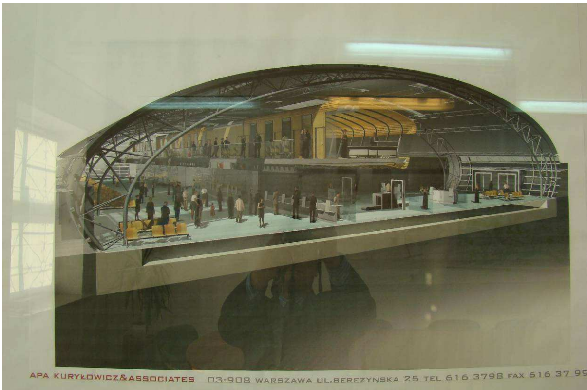
Foto.3. Koncepcja architektoniczna Terminala Pasażerskiego Portu Lotniczego „Warszawa – Modlin” . APA Kuryłowicz & Associates.