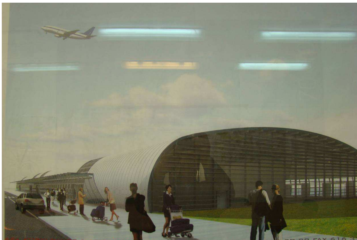
Foto.1. Koncepcja architektoniczna Terminala Pasażerskiego Portu Lotniczego „Warszawa – Modlin” . APA Kuryłowicz & Associates.